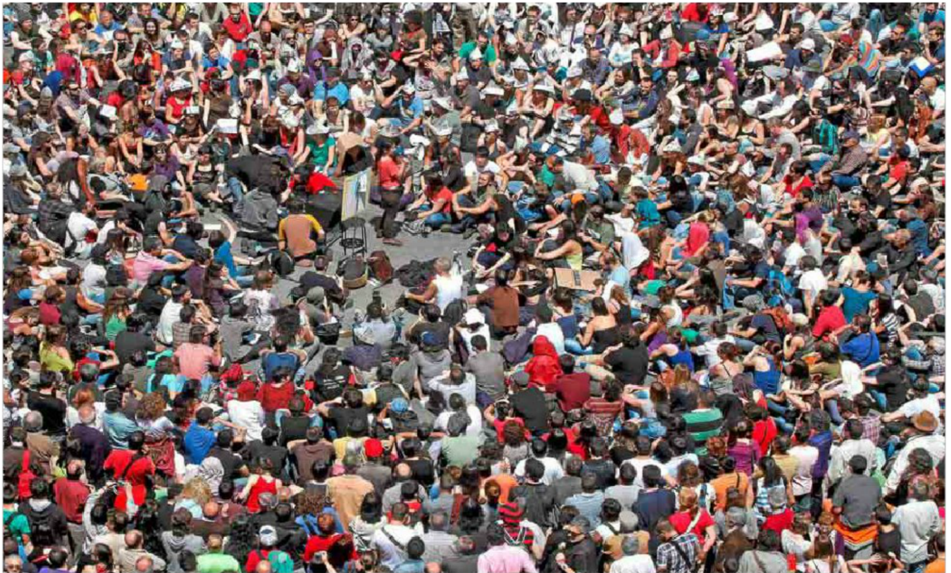
Vista aérea de una multitudinaria asamblea popular en la madrileña Puerta del Sol, el pasado mayo, durante la acampada.